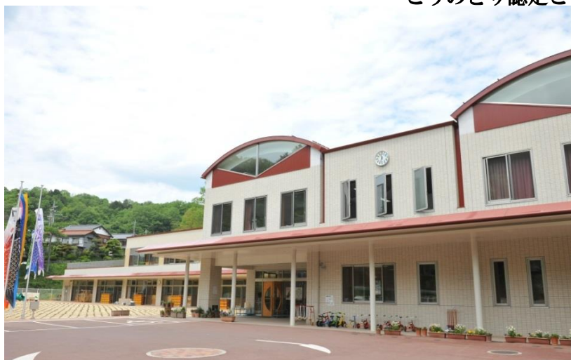
こうのとり認定こども園