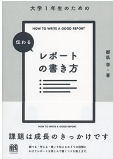
『大学1年生のための伝わるレポートの書き方』 都筑学 有斐閣