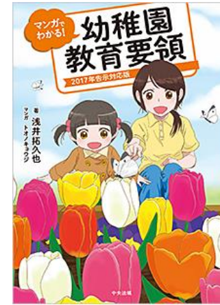
『マンガでわかる!幼稚園教育要領：2017年告示対応版』 浅井拓久也著；トオノキョウジマンガ 中央法規出版