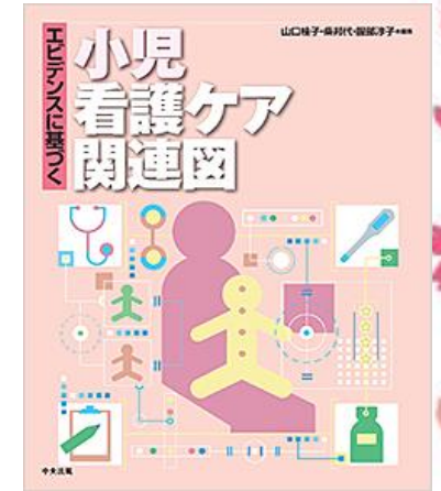
『エビデンスに基づく小児看護ケア関連図』 山口桂子, 柴邦代, 服部淳子 編集 中央法規出版