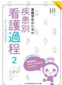
『看護学生のための疾患別看護過程ナーシングプロセス2 / メディカルフレンド社編集部編』