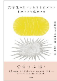
『大学生のストレスマネジメント：自助の力と援助の力』 齋藤憲司, 石垣琢磨, 高野明著 有斐閣