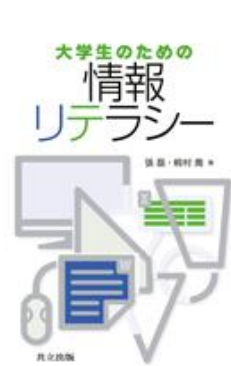
『大学生のための情報リテラシー』 張 磊 共立出版