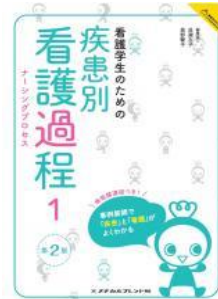
『看護学生のための疾患別看護過程ナーシングプロセス1 / メディカルフレンド社編集部編』