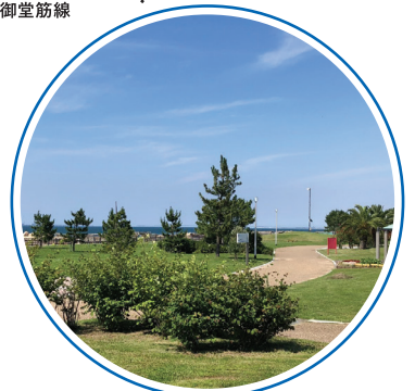
近畿大阪高等学校阪南本校 周辺環境